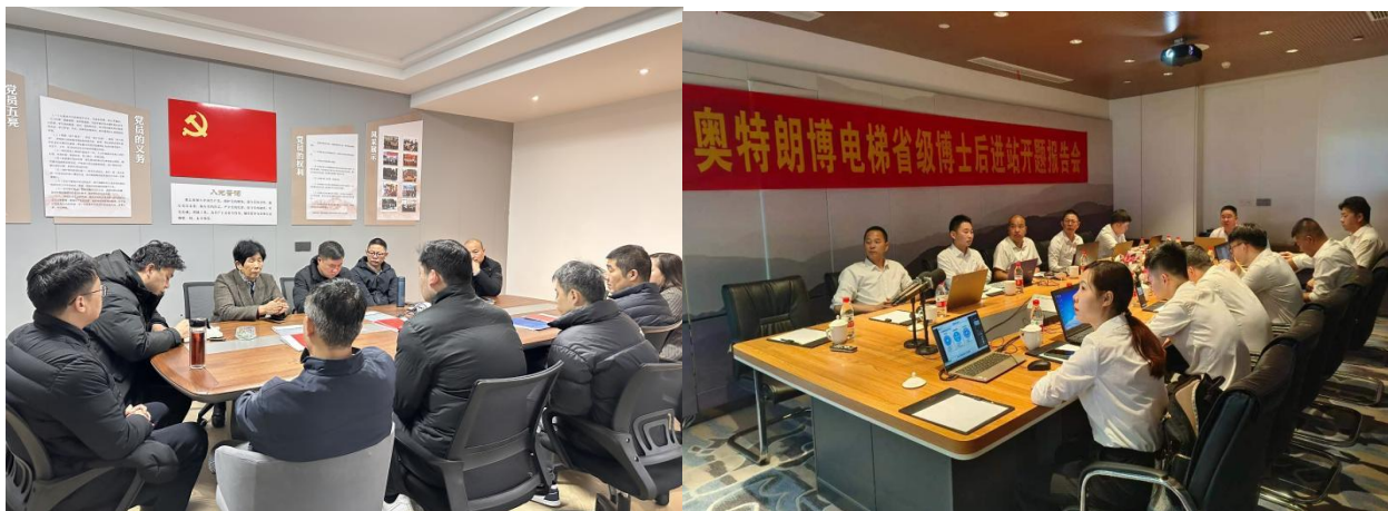
图 3.2-1 各类培训活动

公司每年针对实际和市场形势，识别各部门的培训需求，制定员工培训规划和年度计划，开展职工教育培训，包括质量意识、质量知识、管理制度、专业知识等培训内容。公司每年制定并下发了《年度培训计划》等，对质量诚信教育进行了安排布置。