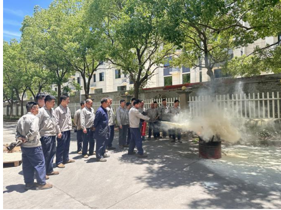
图 6.3-01 2024 年应急演练记录

材。公司每年都会各类应急预案进行每年举行火灾消防、管道泄漏等各种应急预案的演练，演练后我们都会安排《应急演练评价》，总结演练，提出改进建议，不断地完善应急预案，更好地预防事故发生后应急措施的落实和有效性。